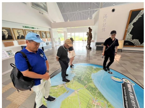
大湊村干拓博物館