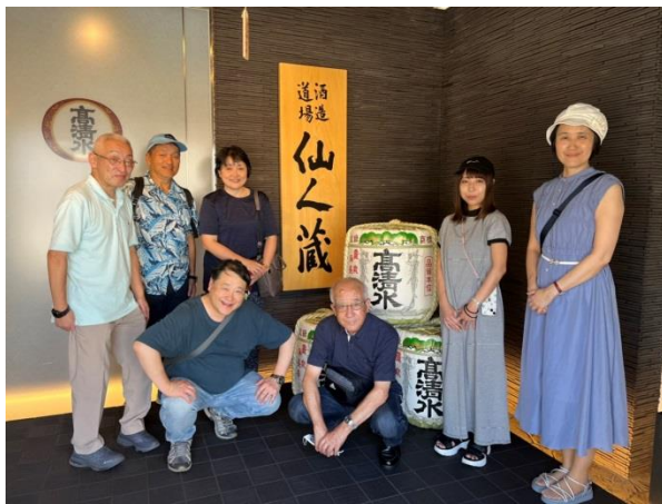
秋田酒類製造（株）蔵見学