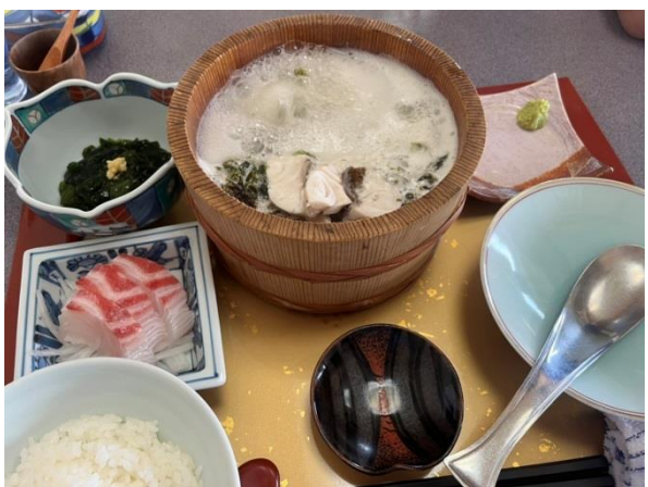
入道崎「美野幸」・鯛の石焼定食