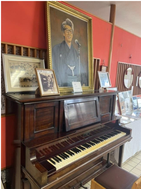
東海林太郎記念館（秋田市）にて