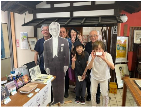
東海林太郎記念館（秋田市）にて