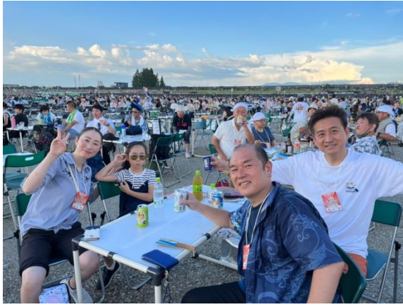
大曲花火会場（大仙市）にて