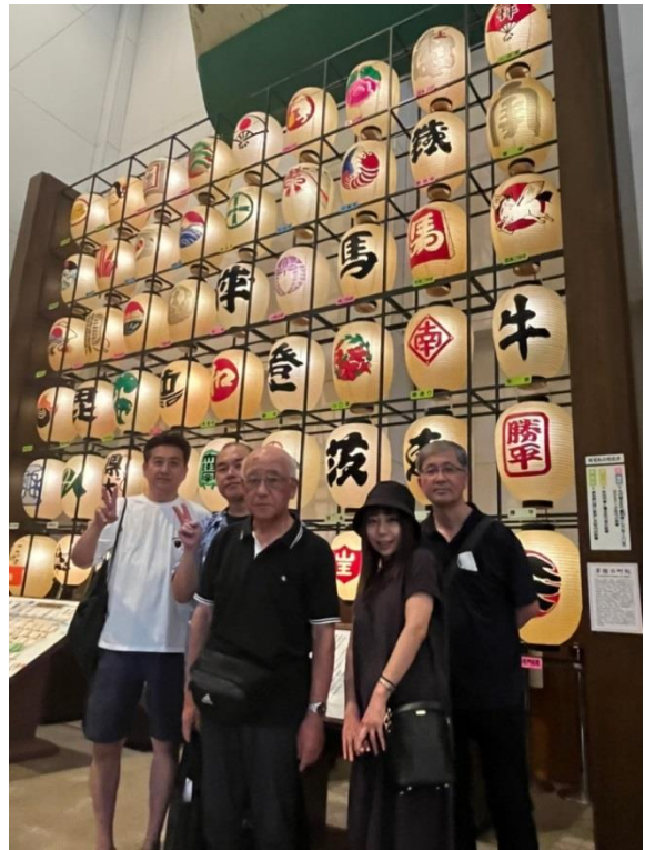
ねぶり流し館（秋田市）にて