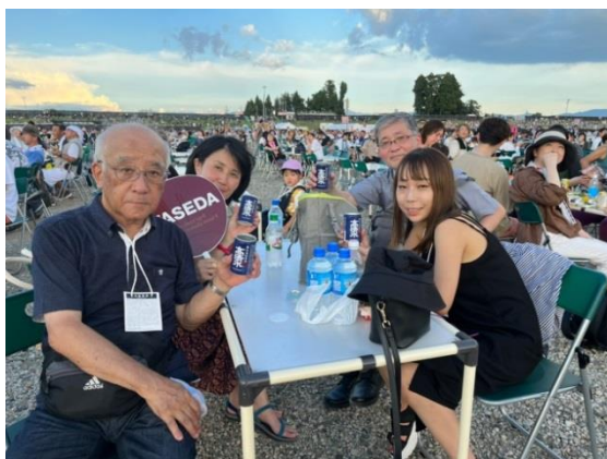
大曲花火会場（大仙市）にて